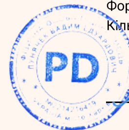
д.пед.н., проф. Вадим ЛУНЯЧЕК

Форма навчання - дистанційна Кількість годин - 3 (0,1 кредита ЄКТС)